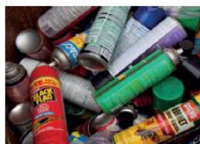
vernici, inchiostri, adesivi e resine