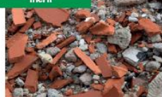
inerti - sabbia gatto senza feci