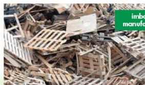
imballaggi e manufatti in legno