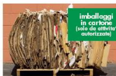
imballaggi in cartone (solo da attività autorizzata)