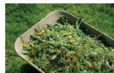
sfalci e potature