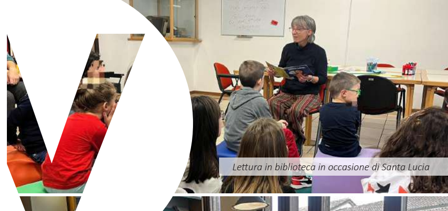
Lettura in biblioteca in occasione di Santa Lucia