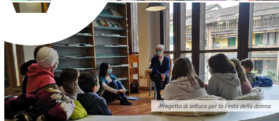
Progetto di lettura per la Festa della donna