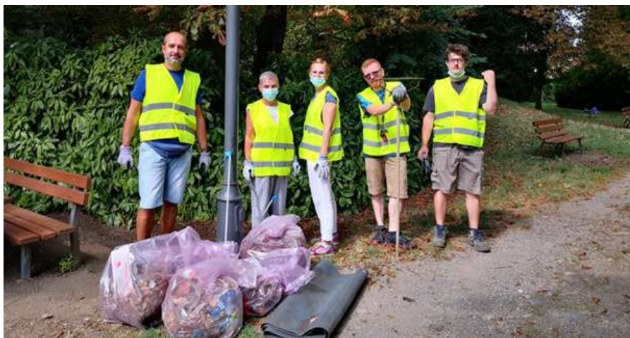
Gruppo volontari ambiente Verdello