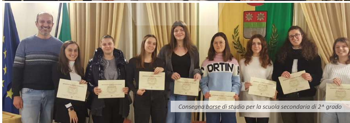
Consegna borse di studio per la scuola secondaria di 2° grado