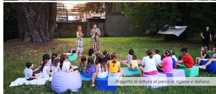
Progetto di lettura al parco in inglese e italiano