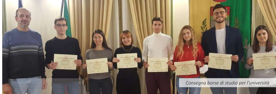
Consegna borse di studio per l'università

* Per fissare l'appuntamento: chiamare il numero 035/0690511 int. 5 oppure inviare la richiesta tramite mail a: protocollo@comune.verdello.bg.it