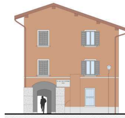
Prospetto Nord - Ovest dei portici di Via Cavour

Termino ringraziando tutti per la fiducia accordatami ed augurando a ciascuno di voi un sereno e proficuo anno nuovo