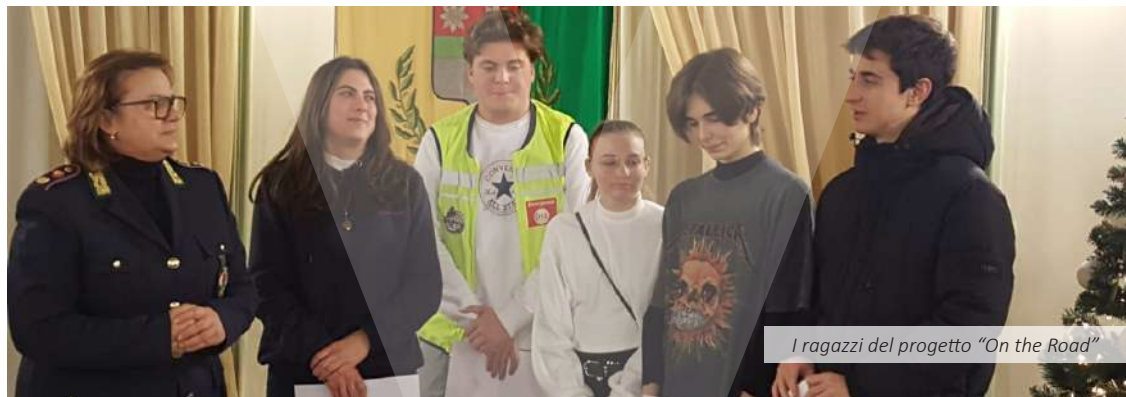
I ragazzi del progetto "On the Road"