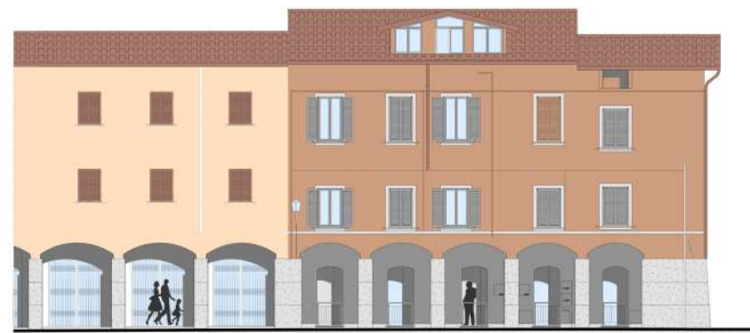
Prospetto Nord - Ovest dei portici di Via Cavour

L'apertura della piazza del Vignale, che versava in condizioni pietose da molti anni, divenuta poi occasione per migliorare la viabilità del centro e per la realizzazione di diversi nuovi parcheggi.