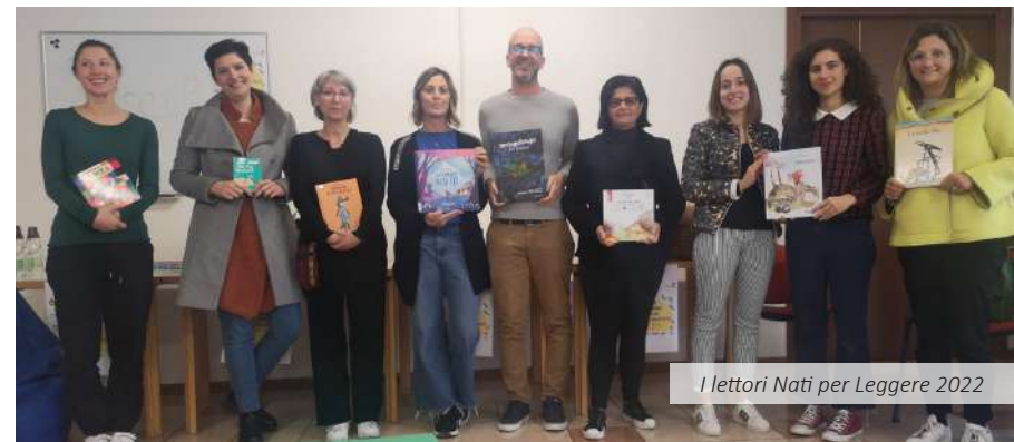
I lettori Nati per Leggere 2022