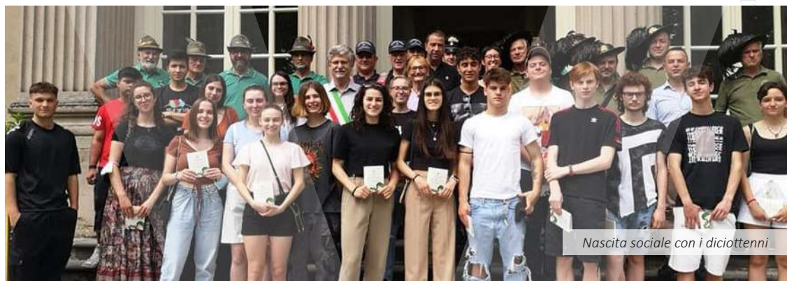
Nascita sociale con i diciottenni