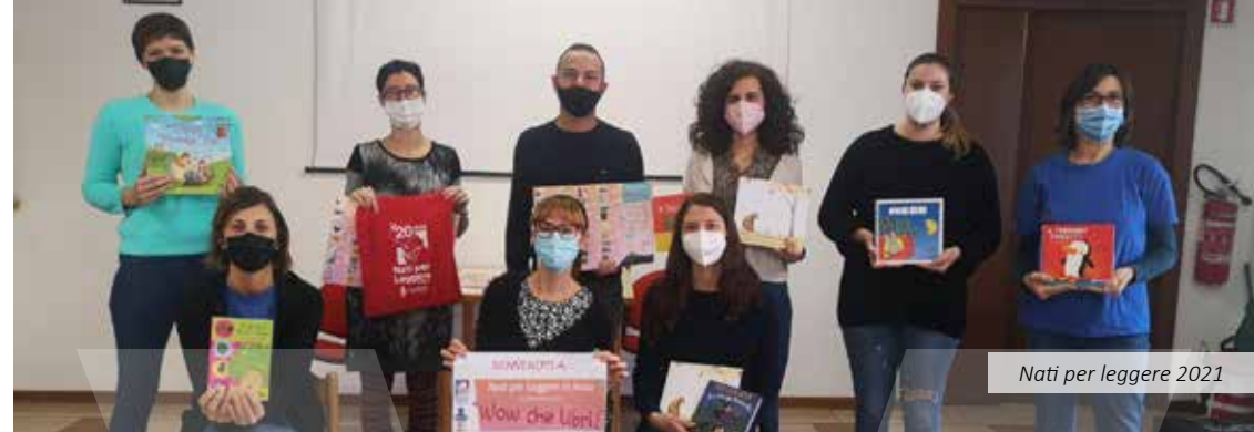
Nati per leggere 2021

* Per fissare l'appuntamento: chiamare il numero 035/0690511 int. 5 oppure inviare la richiesta tramite mail a: protocollo@comune.verdello.bg.it