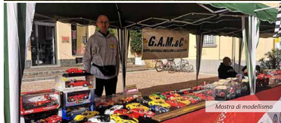
Mostra di modellismo