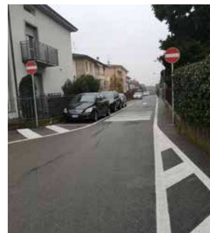
Nuova viabilità in VIA VOLTA