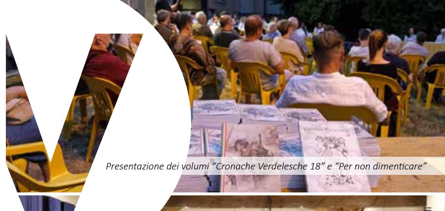
Presentazione dei volumi "Cronache Verdesche 18" e "Per non dimenticare"