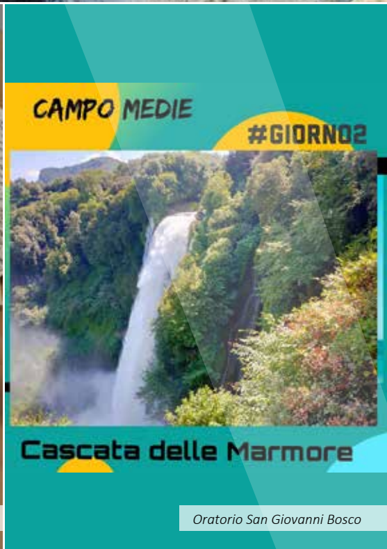
Oratorio San Giovanni Bosco