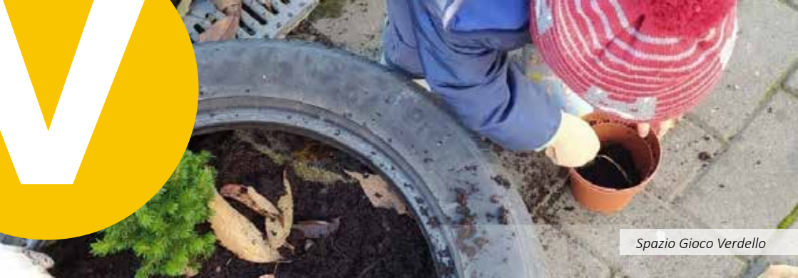
Spazio Gioco Verdello