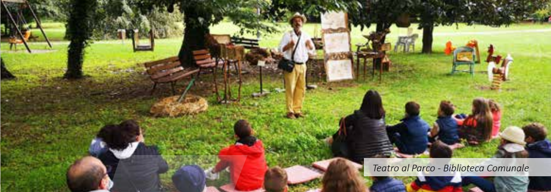
Teatro al Parco - Biblioteca Comunale