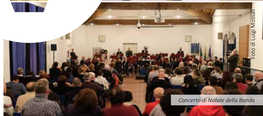
Concerto di Natale della Banda