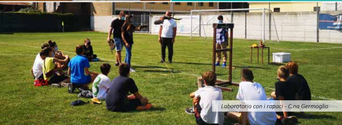
Laboratorio con i rapaci - C.na Germoglio