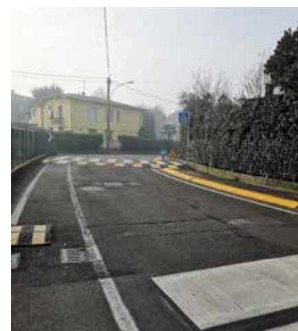
Nuovo dosso in VIA DE GASPERI