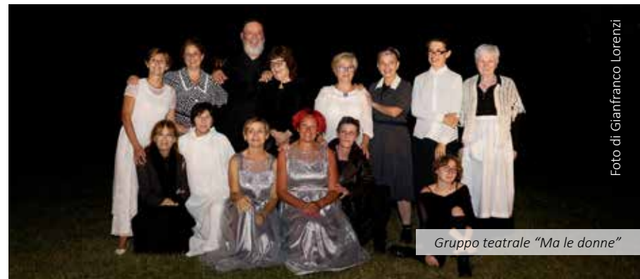
Gruppo teatrale "Ma le donne"