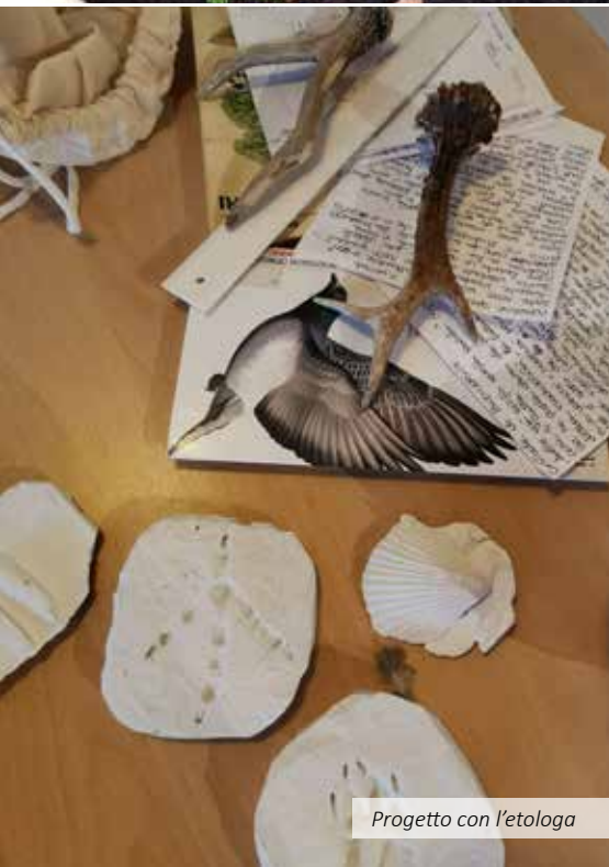
Progetto con l'etologa