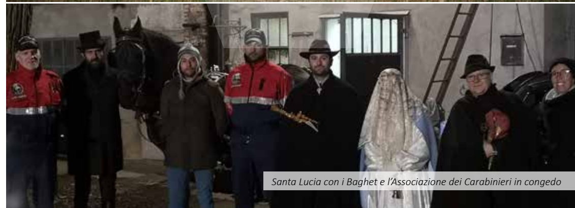
Santa Lucia con i Baghet e l'Associazione dei Carabinieri in congedo